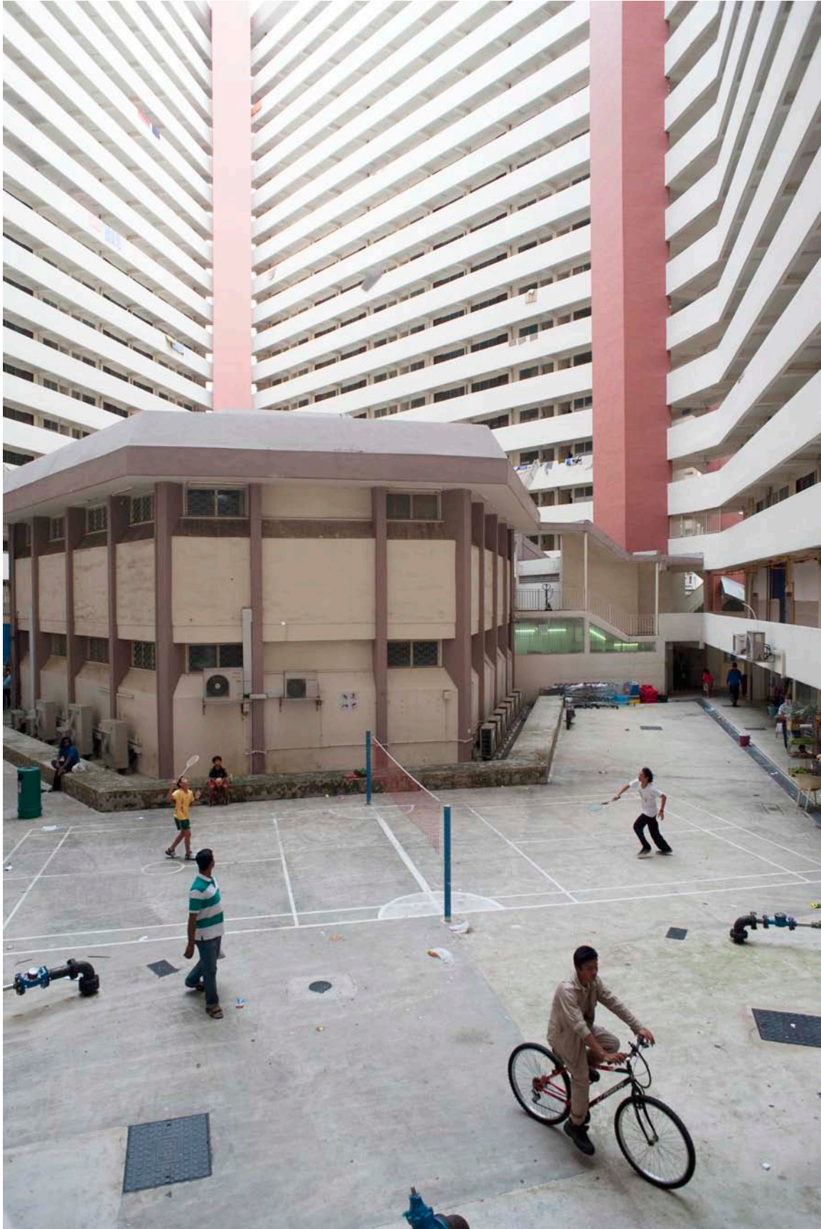
© Philipp Aldrup, The Diamond , 2012