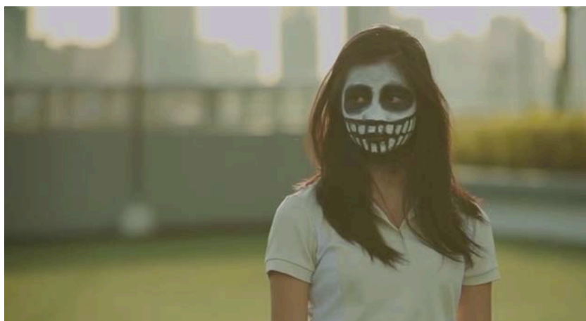
© Jiekai Liao, Before the wedlock house , video, 2012 © Jason Soo, A short film on the May 13 Generation , video, 2014 © Sookoon Ang, Exorcize me , video, 2013