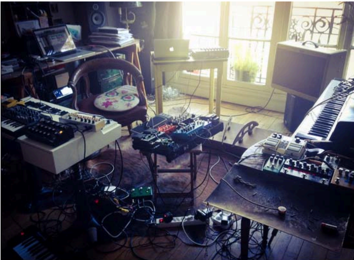
Ezzam Rahman, Yan/Smoke , Linzhou Wen Hua Guan, 2014 Rehearshal FOU DRE! for Ho Tzu Nyen vs FOU DRE! , 6 May 2015