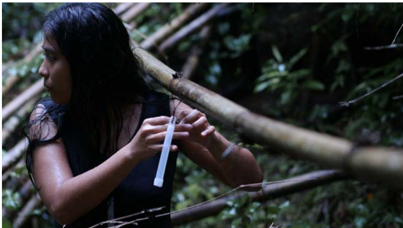
© Rajendra Gour, Eyes , 16mm film, 1967 © Ho Tzu Nyen, The cloud of unknowing , video, 2011 © Kent Chan, Image of the dark , video, 2014