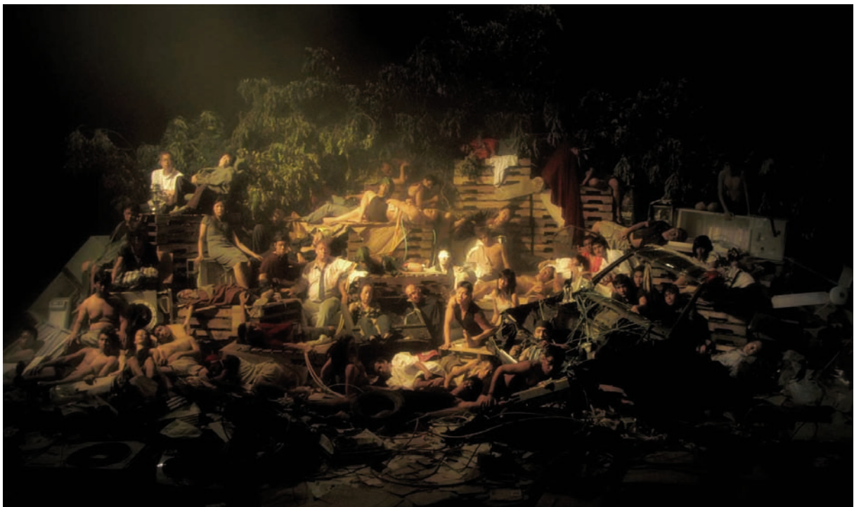
© Ho Tzu Nyen, EARTH , video, 2009