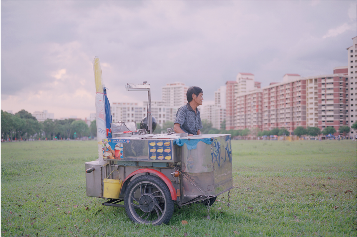
© Nguan, Untitled , from the series Singapore , 2012