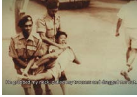
A short film on the May 13 Generation