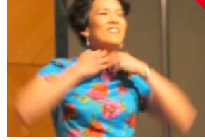
Art Must Be Beautiful